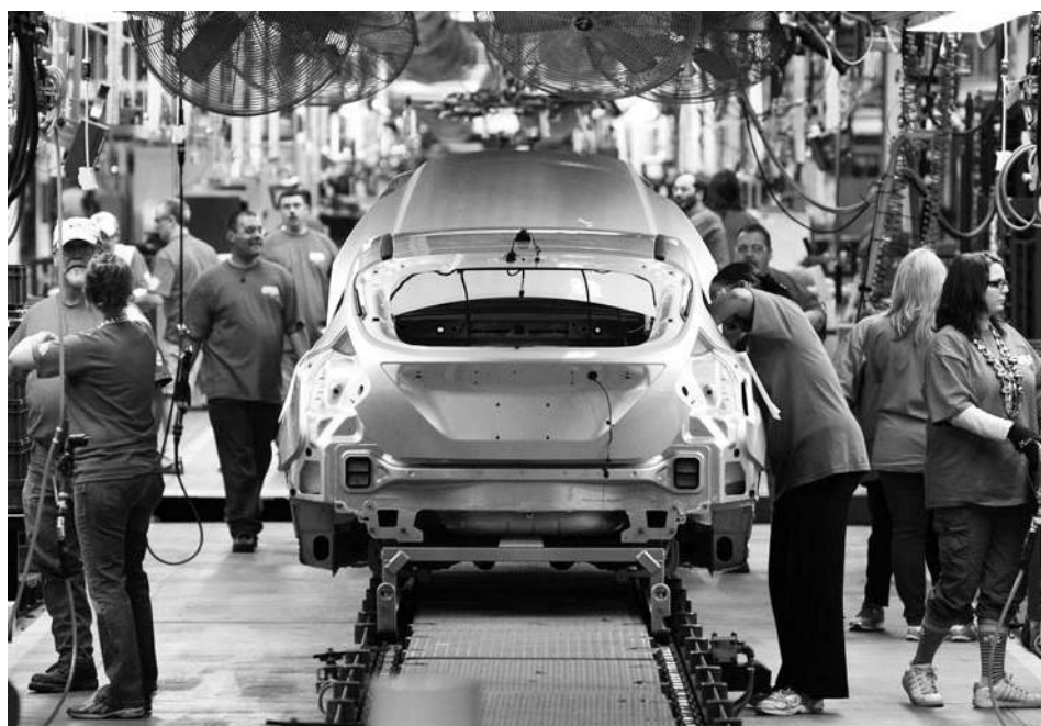
Industria Automotriz Mexicana Producción total de 1994 a 2015

dólares para producir autos compactos en San Luis Potosí y trasladar a una de sus plantas de Detroit (con una inversión de 700 millones de dólares) la producción de los autos híbridos que ya se venían produciendo en Hermosillo, además de una nueva generación de autos eléctricos cuya fabricación involucra nuevas capacidades de innovación productiva y conocimiento científico técnico con personal altamente calificado. De igual forma, con una inversión adicional, la compañía anunció el traslado a Hermosillo de una parte de la producción de los modelos que inicialmente se habrían de producir en San Luis Potosí, con ello consolidaría la fabricación de los modelos Focus, Fusión y Lincoln MKZ en la capital de Sonora, pero en junio pasado canceló la producción del Focus en la entidad para trasladarla a China. Más que de una buena renegociación del TLCAN, el futuro de la industria automotriz de México depende