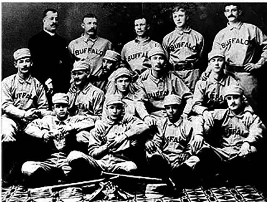
Buffalo Bisons, 1887: Frank Grant, segundo de derecha a izquierda, al frente.

Frank Grant ingresó a Cooperstown en el 2006 junto con Sol White Willard Brown, Alex Pompez, Mule Suttles, J. L. Wilkinson, Jud Wilson, los cubanos José Méndez y Cristóbal Torriente, entre otros grandes estrellas de Ligas Negras